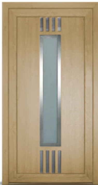
Model: Solar 826 Seria: Adeco