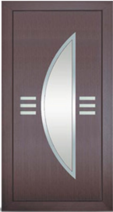
Model: Oberon 005, 006 Seria: Adeco