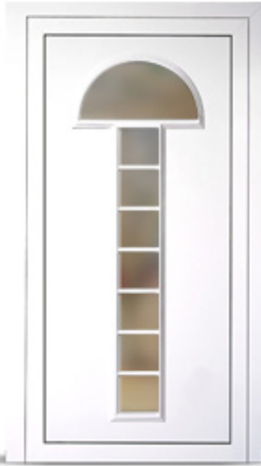
Model: Opal 066 Seria: Adeco