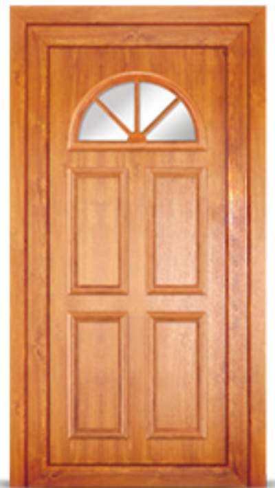
Model: Texel 425 Seria: Adeco