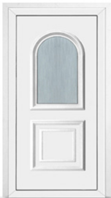
Model: BL05 Seria: Vetrex White Comfort