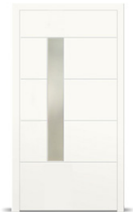
Model: Cia C23, C24 Seria: Adeco