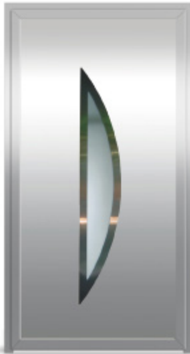
Model: EK04 Seria: Vetrex Premium Comfort