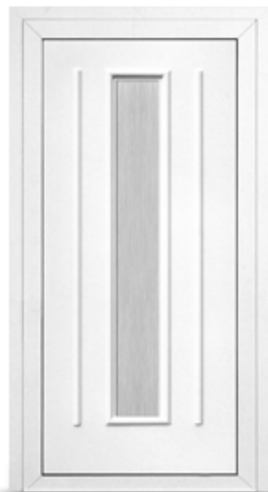
Model: BL11 Seria: Vetrex White Comfort