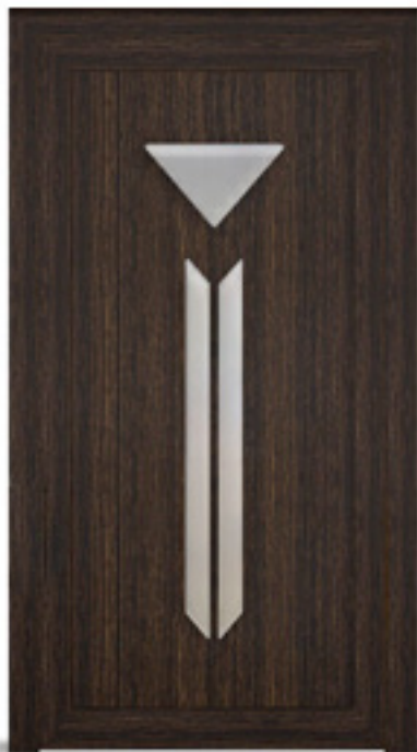
Model: Amethyst 393 Seria: Adeco