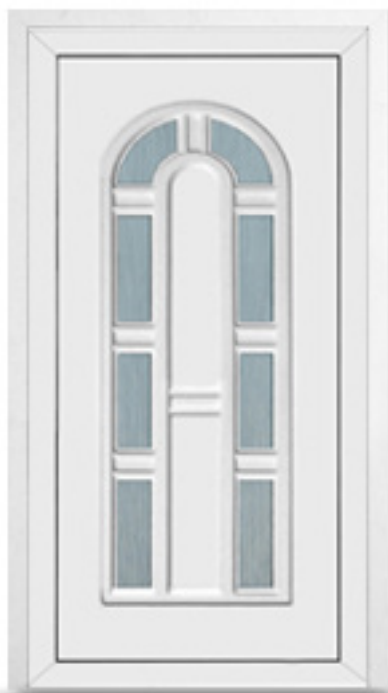
Model: BL02 Seria: Vetrex White Comfort