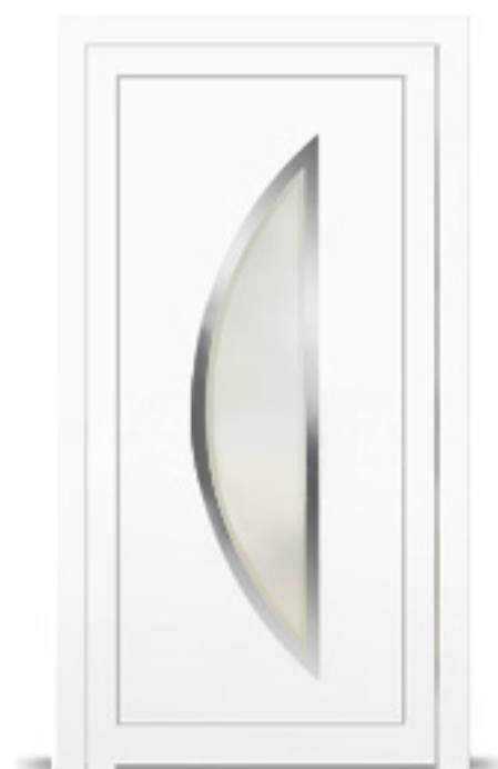
Model: Luxa C33, C35 Seria: Adeco