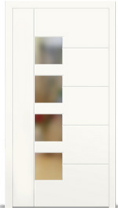
Model: Berneo H04, H05 Seria: Adeco