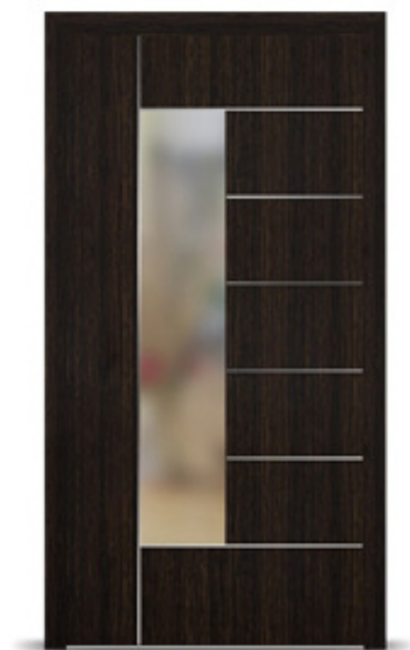
Model: Metris F90, F91 Seria: Adeco