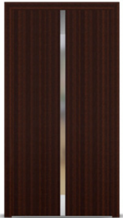
Model: Penda B33 Seria: Adeco