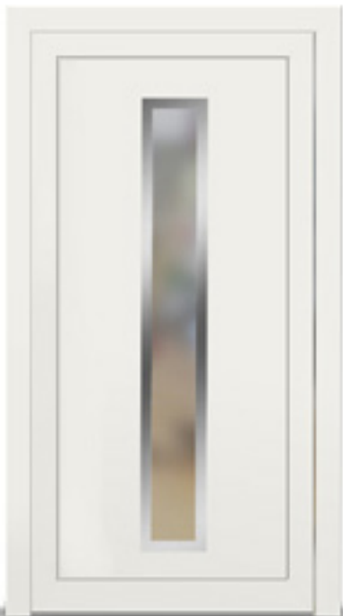
Model: Zento 514 Seria: Adeco