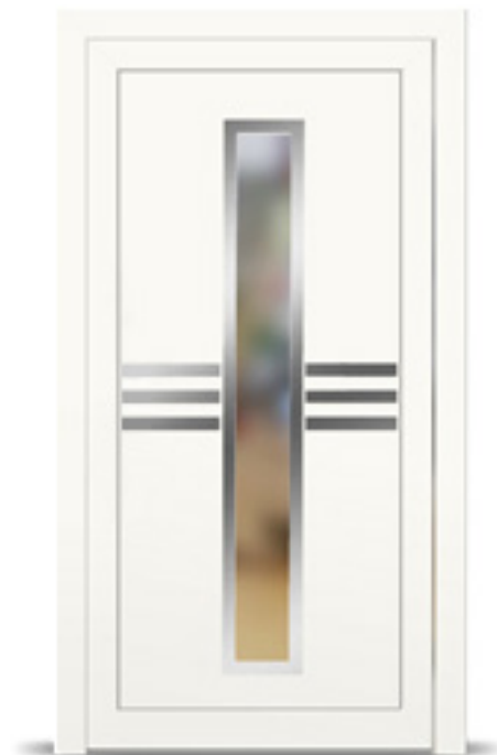
Model: Indura 825 Seria: Adeco