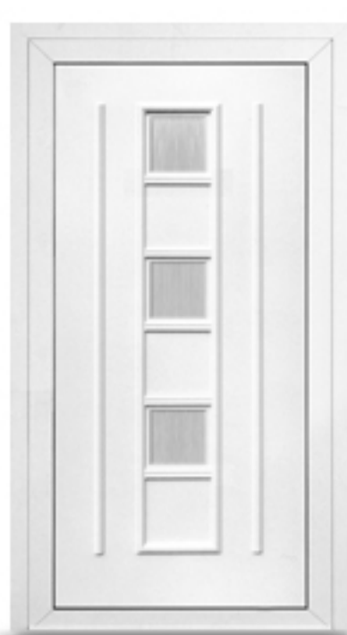
Model: BL12 Seria: Vetrex White Comfort