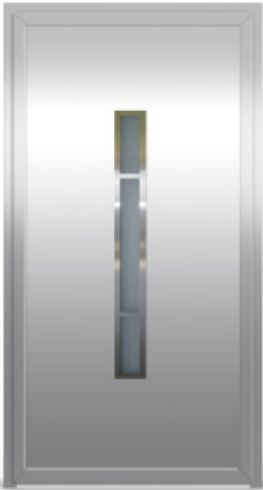
Model: EK03 Seria: Vetrex Premium Comfort