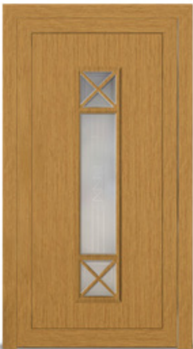
Model: Secco 727 Seria: Adeco