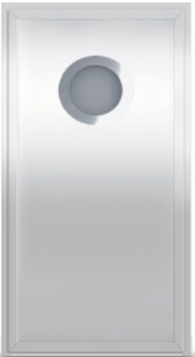
Model: EK22 Seria: Vetrex Premium Comfort