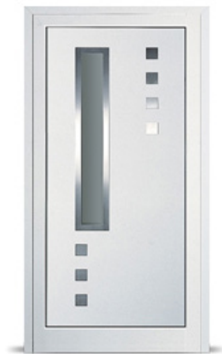
Model: Index 832 Seria: Adeco