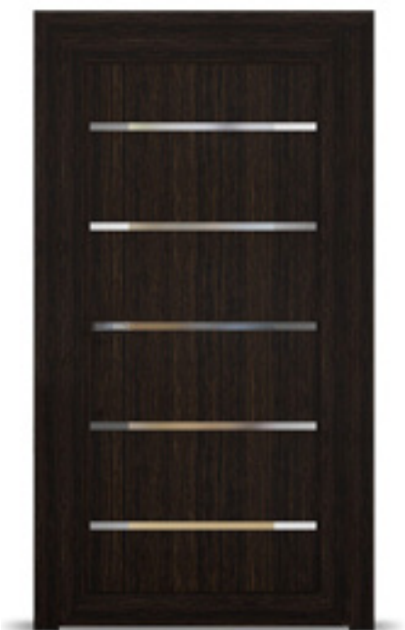
Model: Linora K49 Seria: Adeco