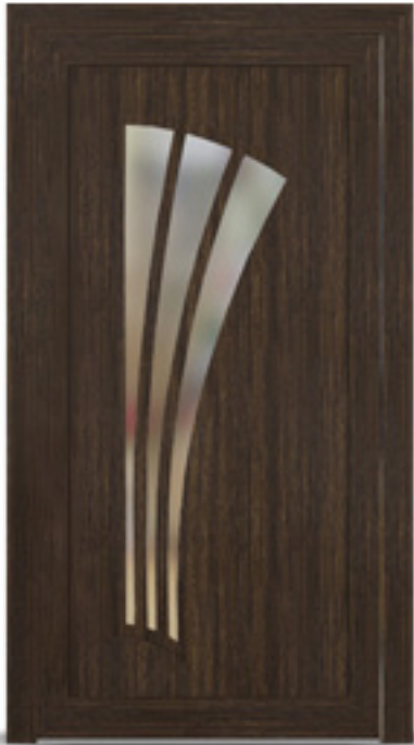
Model: Zenit 240, 243 Seria: Adeco