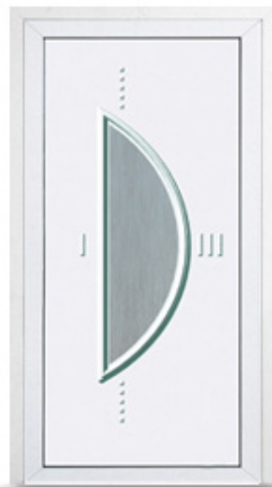
Model: BL10 Seria: Vetrex White Comfort